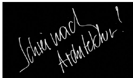
Studio3.jpg Symbolbild (Institut für experimentelle Architektur ./studio3)