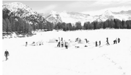
Studio1.jpg Workshop am Sattelberg im Rahmen der Entwerfen 1 Übung „And All About Again“ (Institut für Gestaltung – Studio1)