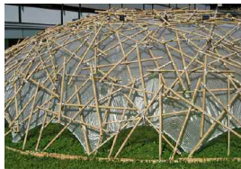
Koge.jpg mikadoweb, Florentine Sack und Studierende (Institut für Gestaltung – KOGE Konstruktion und Gestal- tung)