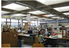
Potenziale_Zeichensaal.jpg Blick in den Zeichensaal