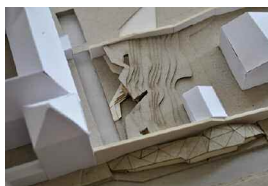
Baugeschichte.jpg Daniel Kranebitter, Revitalisierung des bischöflichen Obst- gartens in Brixen, Entwurf M2, WS 2012/13 (Institut für Baugeschichte und Denkmalpflege)