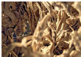
Hochbau.jpg Robotic FOAMing, Entwerfen 1 (Institut für experimentelle Architektur.Hochbau)