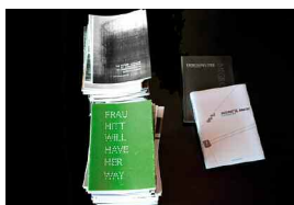
Architekturtheorie.jpg Bücher produziert von Studierenden im Rahmen von Architekturtheorie (Institut für Architekturtheorie)